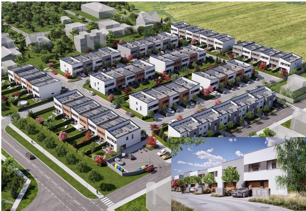
Obr. č. 13 a 14: MSI Capital vizualizace projektu ŘRD Satalice