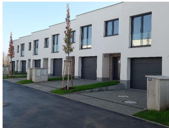
Obr. č. 9 a 10: MSI Capital snímky projektu RD Letňany