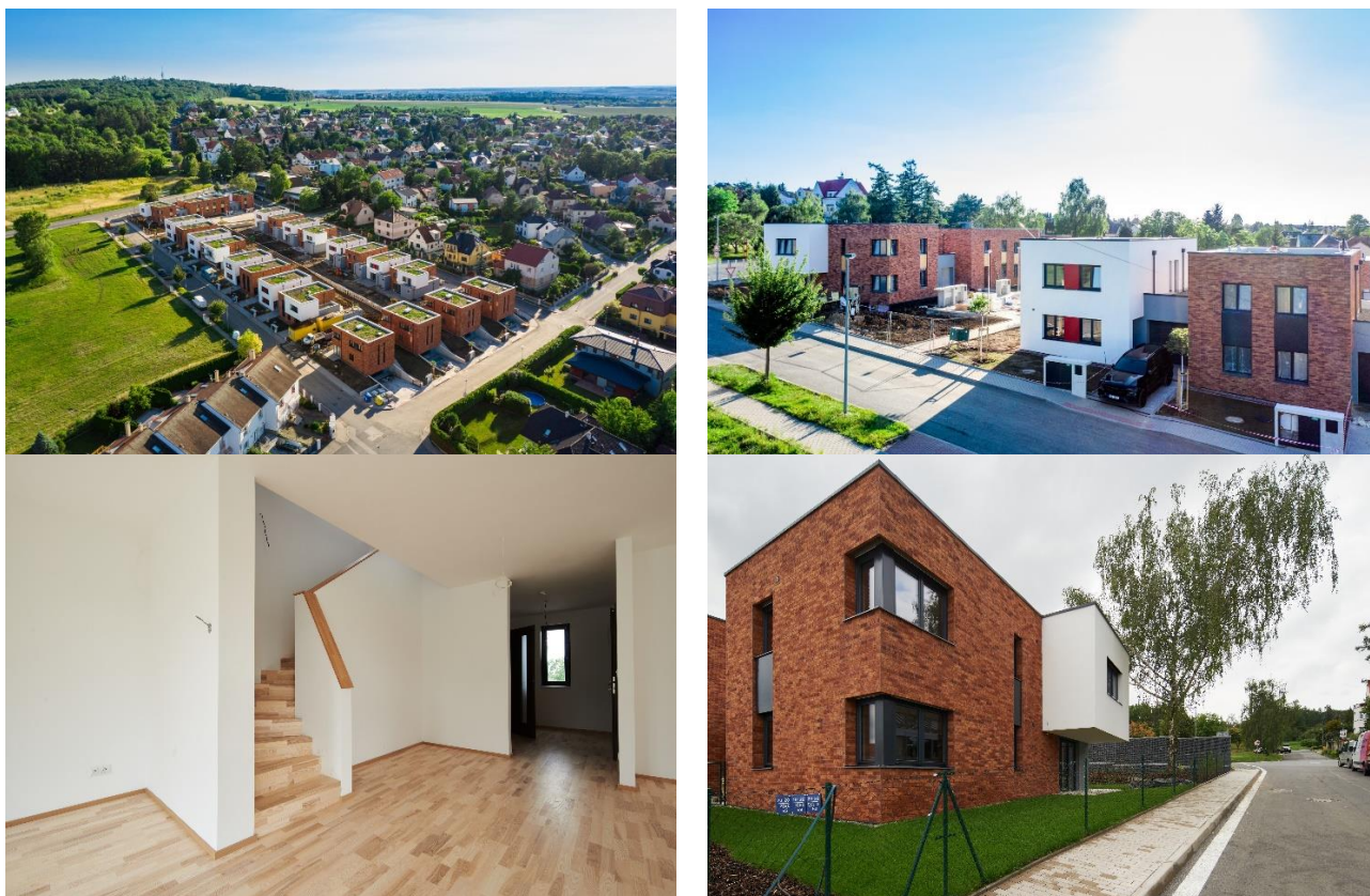
Obr. č. 5 až 8: MSI Capital snímky projektu Ďáblice

Územní rozhodnutí pro 1. etapu nabylo právní moci v lednu roku 2020, pro 2. etapu nabylo právní moci v dubnu roku 2020. Stavební povolení na projekt bylo vydáno na konci roku 2020 a následně byla zahájena výstavba s termínem dokončení v září 2022. Výstavba projektu byla dokončena již v červenci 2022 a ke konci srpna 2022 byl pak vydán kolaudační souhlas s užíváním rodinných domů.