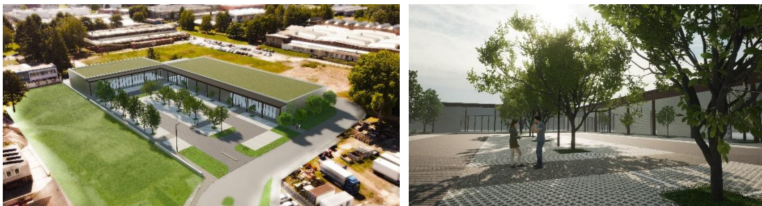
Obr. č. 15 a 16: MSI Capital vizualizace projektu OC Lutín