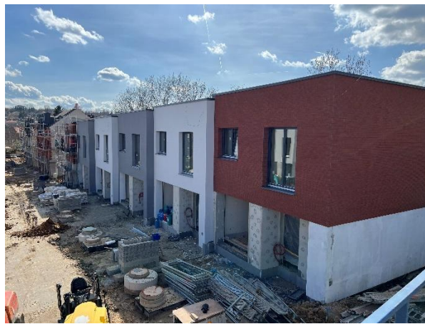
Obr. č. 11 a 12: MSI Capital snímky projektu RD Ruzyně